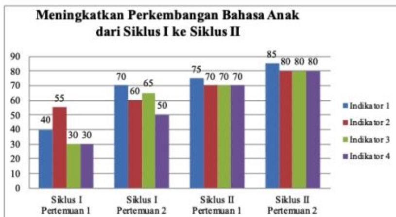
Grafik: 3 Perkembangan Bahasa anak dengan Permainan Menyambung Cerita Dari Siklus I ke Siklus II

Berdasarkan grafik 3 di atas dapat dilihat secara jelas peningkatan persentase indikator 4 perkembangan bahasa anak pada siklus I pertemuan pertama 30% dan