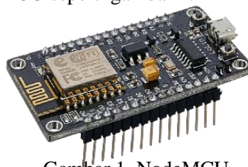
Gambar 1. NodeMCU

Node MCU. Node MCU merupakan pengontrol yang memiliki system-on-chip (SoC) ESP8266 yang menggabungkan inti utama 32-bit pada mikrokontroler, dan didukung oleh perangkat penguat arus-tegangan, dan tingkat kebisingan yang rendah saat menerima penguat[5]. Dapat dilihat NodeMCU seperti gambar 1.