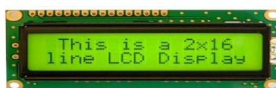
Gambar 4. LCD 2x16

LCD 16x2. LCD adalah tersedia untuk menampilkan gambar sewenang-wenang atau gambar tetap dengan konten informasi rendah, yang dapat ditampilkan atau disembunyikan, seperti kata-kata preset, angka, dan tampilan 7-segmen seperti pada sebuah jam digital. LCD 16x2 dapat dilihat seperti pada gambar 4.