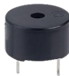
Gambar 3. Buzzer

Buzzer. Buzzer adalah perangkat sinyal audio, yang mungkin mekanis, elektromekanis, atau piezoelektrik. Penggunaan buzzer sebagai perangkat alarm, pengatur waktu dan konfirmasi input pengguna seperti klik mouse atau penekanan tombol[7]. Buzzer merupakan sebuah komponen yang sering di gabungkan kedalam rangkaian elektronika yang biasanya difungsikan sebagai alarm atau penanda. Buzzer dapat dilihat seperti pada gambar 3.