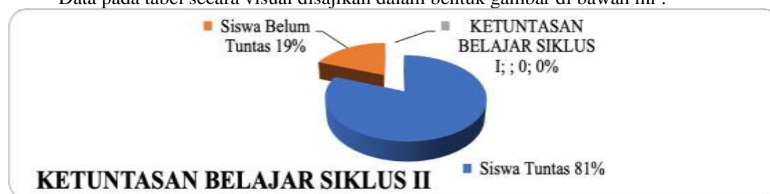
Gambar 2 Ketuntasan Belajar Siklus II

Data pada tabel secara visual disajikan dalam bentuk gambar di bawah ini :