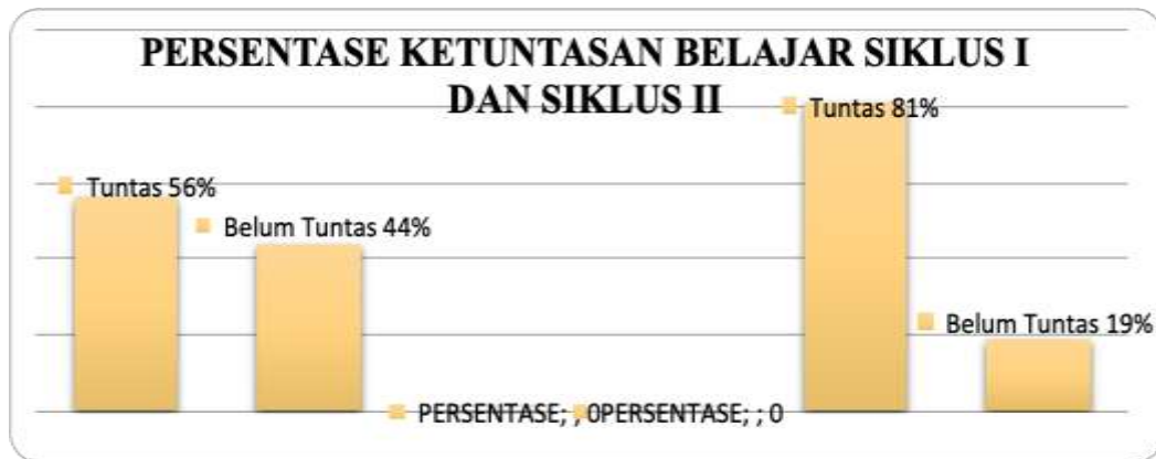
Gambar 3 Persentase Ketuntasan Belajar Siklus I dan Siklus II

Dari gambar 3 di atas menggambarkan peningkatan yang terjadi dalam pencapaian ketuntasan belajar siswa dalam menjawab pertanyaan pada siklus I dan siklus II memperlihatkan bahwa perbaikan pembelajaran Agama Islam telah berhasil dengan baik. Berdasarkan hasil tes siswa dari siklus I siswa yang mendapat nilai tuntas adalah 56% meningkat menjadi 81% pada siklus II, atau kenaikan ketuntasan belajar siswa dari siklus I sampai siklus II adalah 25%. Kenaikan hasil tes siswa menjawab pertanyaan menjelaskan bahwa penggunaan model pembelajaran Word Square ini, disamping meningkatkan pemahaman siswa terhadap materi juga meningkatkan kemampuan siswa dalam menjawab soal tes, hal ini dibuktikan dengan meningkatnya kemampuan siswa menjawab pertanyaan pada setiap pertemuan.