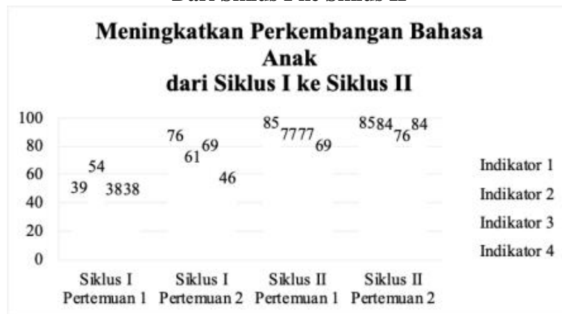
Grafik: 3 Perkembangan Bahasa anak dengan Permainan Menyambung Cerita Dari Siklus I ke Siklus II

Berdasarkan grafik 3 di atas dapat dilihat secara jelas peningkatan persentase indikator 4 perkembangan bahasa anak pada siklus I pertemuan pertama 38% dan pertemuan kedua 46% meningkat pada siklus II pertemuan pertama menjadi 69%, pada pertemuan kedua siklus II perkembangan bahasa anak meningkat lagi menjadi 84%.