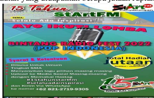
Gambar Brosur Lomba Bintang Radio Fest 2022

Event yang dibuat oleh radio Start FM merupakan sebuah kegemaran dari sahabat Start FM, sehingga dalam rangka 15 Tahun berdirinya radio ini akan tetap membuat para pendengarnya tetap menantikan program dan hal menarik lainnya, terkhusus bagi pendengar setia radio Start FM yang memiliki potensi dan keinginan untuk mengikuti event bintang radio fest 2022 (Pop Indonesia) telah dibuka untuk umum dan tingkat SMA, dan bebas menyanyikan lagu pilihan yang diinginkan dan di upload ke media sosial masing-masing dengan memakai hastag#15tahunstartfm#selalu ada inspirasi dan dikirim via Whatsapp ke nomor +6282127199305, total hadiah yang didapatkan berupa jutaan rupiah.