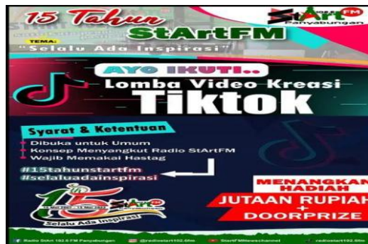
Gambar Event yang berlangsung di akun Tiktok

Berbagai event yang diselenggarakan oleh radio Start FM memang berbeda dengan radio lainnya, selain akun tiktok juga merambat kepada semua SDM yang ada di daerah Panyabungan bahkan dari luar daerah pun bisa ikut serta dalam mengikuti acara yang diselenggarakan, karna selain menjadi hiburan semata juga menambah wawasan dan juga ilmu pengetahuan yang sangat bermanfaat bagi peminat yang mempunyai kreatifitas dan keinginan yang kuat menjadi seorang penyiar. Dalam utang tahun yang 15 tahun, radio Start FM membuat suatu lomba tentang baca berita ( News Anchor Competition ), syarat dan ketentuan agar bisa mengikuti lomba, pria/ wanita yang berumur 16-25 Tahun, dan setelah melakukan rekaman tentang baca berita, hasil rekaman tersebut di kirim ke Whatsapp (085262727750) dan mengupload di akun media sosial masing-masing dengan hastag #15tahunstartfm#selaluadainspirasi. Hadiah yang akan didapatkan berupa jutaan rupiah dan doorprize .