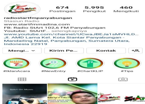
Gambar Akun Instagram Radio Start FM Panyabungan

Daya penarik massa sangat penting untuk diperhatikan karena stasiun- stasiun penyiaran mendapatkan keuntungan dengan cara semaksimal mungkin untuk menarik perhatian pendengar dengan membenahi program siaran semenarik mungkin dan sesuai dengan kebutuhan pendengar. Perbedaan minat dan minat yang disukai oleh pendengar harus diperhatikan oleh radio siaran. Sehingga semuanya dapat diakomodir dalam program yang disajikan. Untuk menarik minat pendengar harus mengikuti perkembangan teknologi karena khalayak sekarang dominan hanya menggunakan medsos dan mengikuti perkembangan yang sedang viral di kalangan masyarakat, untuk itu, radio Start FM kini terjum menggunakan daya internet tersebut dengan bergabung di media sosial yaitu, Facebook, Instagram, Youtube, Tiktok, dan memiliki berbagai event-event yang menarik untuk diikuti oleh kalangan masyarakat dari berbagai kalangan mulai remaja, dewasa dan anak-anak.