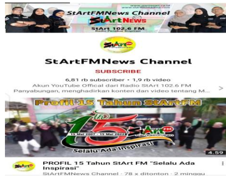
Gambar Akun Youtube Radio Start FM Panyabungan

Teknis pelaksanaan komunikasi, ditinjau berdasarkan teknis pelaksanaannya, komunikasi dapat dirumuskan sebagai kegiatan dimana seseorang menyampaikan pesan melalui media tertentu kepada orang lain dan sesudah menerima pesan serta memahami sejauh mana kemampuannya, penerima pesan menyampaikan tanggapan melalui media tertentu kepada orang yang menyampaikan pesan tersebut kepada pendengar. (Asep, 2021:52) Radio Start mendatangkan narasumber, tokoh budaya dalam acara tertentu yang berkaitan dengan apa topik yang lagi hits di bahas, dengan demikian informasi yang di dapatkan jelas dari mana sumbernya dan ringkas dalam menfokuskan kepada pokok pembicaraan, dan memiliki kebenaran informasi karena jika tidak informasi tersebut tidak akan ada nilainya. Lengkap dengan menyampaikan informasi yang diperlukan tidak membuat pendengar merasa bingung dan bertanya-tanya apa yang tidak paham.