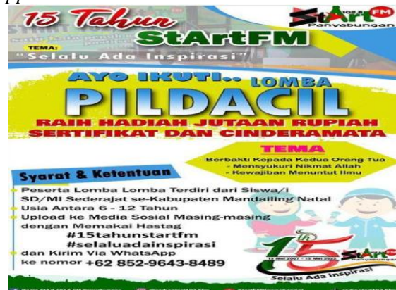
Gambar Brosur Lomba Pildacil.

Tema selalu ada inspirasi memang patut digunakan oleh radio Start FM, karna selain kalangan dewasa, remaja, anak-anak juga memiliki event yang diselenggarakan dalam memeriahkan acara ulang tahun radio Start FM yang ke 15. Lomba pildacil bertemakan berbakti kepada kedua orang tua, mensyukuri nikmat Allah, kewajiban menuntut ilmu. Tiga tema tersebut merupakan suatu pembelajaran disamping untuk mengikuti lomba, anak-anak juga dapat mempelajari makna dari pidato tentang pentingnya berbakti kepada orang tua, mensyukuri nikmat, kewajiban dalam menuntut ilmu. Peserta lomba terdiri dari siswa/siswi SD/MI sederajat se-Kabupaten Mandailing Natal. Usia peserta antara 6-12 Tahun, pidato tersebut di upload ke media sosial dengan memaki hashtag #15tahunstartfm #selaluadainspirasi dan di kirim via whatsapp ke nomor =6285296438489.