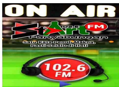
Gambar Aplikasi Start FM Ketika ON AIR

Perkembangan teknologi memang semakin canggih, jika tidak ingin tersingkir atau tidak di minati lagi oleh khalayak maka jalan satu-satunya adalah mengikuti perkembangan yang ada. Dalam hal mempertahankan maupun meningkatkan jumlah pendengar radio Start FM harus mampu bangkit dan ikut serta memanfaatkan kecanggihan teknologi dengan mengadakan ON AIR, dan memiliki aplikasi tersendiri untuk mencakup pendengar semakin luas dan radio Start FM dapat di dengarkan oleh berbagai daerah, kota, maupun luar negeri. Karena ada tiga yang masuk kategori Radio Garden salah satunya adalah radio Start FM. Itulah yang menyebabkan radio Start FM dapat di nikmati oleh pendengar di luar negeri, atau orang yang merantau ke luar negeri jika merindukan kampung halamannya dapat mendengarkan radio Start FM sebagai pelepas rasa rindu.