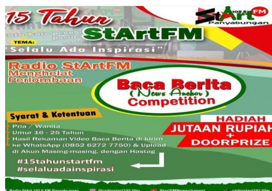
Gambar Brosur Lomba baca berita

Berbagai event yang diselenggarakan oleh radio Start FM memang berbeda dengan radio lainnya, selain akun tiktok juga merambat kepada semua SDM yang ada di daerah Panyabungan bahkan dari luar daerah pun bisa ikut serta dalam mengikuti acara yang diselenggarakan, karna selain menjadi hiburan semata juga menambah wawasan dan juga ilmu pengetahuan yang sangat bermanfaat bagi peminat yang mempunyai kreatifitas dan keinginan yang kuat menjadi seorang penyiar. Dalam utang tahun yang 15 tahun, radio Start FM membuat suatu lomba tentang baca berita ( News Anchor Competition ), syarat dan ketentuan agar bisa mengikuti lomba, pria/ wanita yang berumur 16-25 Tahun, dan setelah melakukan rekaman tentang baca berita, hasil rekaman tersebut di kirim ke Whatsapp (085262727750) dan mengupload di akun media sosial masing-masing dengan hastag #15tahunstartfm#selaluadainspirasi. Hadiah yang akan didapatkan berupa jutaan rupiah dan doorprize .