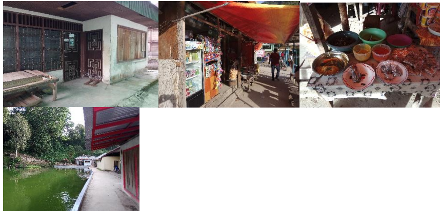
Gambar 3. Ketersediaan warung di kawasan wisata Sungai Janiah

Hasil observasi peneliti yang dilakukan belum ditemukan penyedia tempat makan dan minum bagi wisatawan. Fasilitas yang sudah ada berupa warung-warung yang belum memadai dan hanya menyediakan makanan ringan dan minuman. Untuk lebih jelasnya dapat dilihat pada gambar dibawah ini.