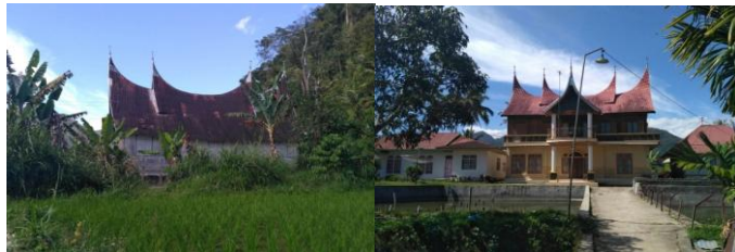
Gambar 2. Potensi Akomodasi Penginapan di Kawasan Wisata Sungai Jariah

Hasil observasi peneliti di Destinasi Wisata Sungai Jariah terlihat belum adanya akomodasi atau penginapan bagi wisatawan. Namun berdasarkan potensi yang ada peneliti melihat disini dapat dikembangkan suatu penginapan untuk wisatawan, karena banyak terdapat rumah milik masyarakat yang kosong serta rumah adat yang dibiarkan begitu saja. Untuk lebih jelasnya dapat dilihat pada dokumentasi dibawah ini.