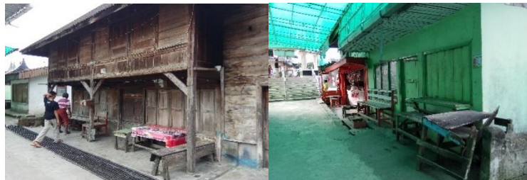
Gambar 4. Tempat potensial untuk penyediaan oleh-oleh bagi wisatawan

Berdasarkan observasi yang peneliti lakukan belum ditemukan cenderamata atau oleh-oleh khas yang bisa dibawa pulang. Meskipun demikian disana ditemukan tempat atau rumah lama yang bisa dibuka menjadi pusat perbelanjaan yang menyediakan cenderamata atau oleh-oleh bagi wisatawan. Untuk lebih jelasnya dapat dilihat pada dokumentasi berikut ini: