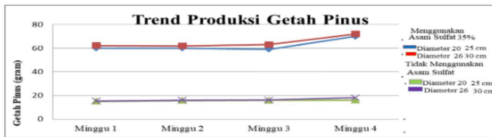
Gambar 1. Nilai Rata-Rata Hasil Panen Getah Pinus.

Pada grafik diatas dapat dilihat bahwa peningkatan produktivitas yang terlihat nyata yakni pada pohon pinus yang tidak menggunakan asam sulfat kelas diameter 25 – 30 cm dan pohon yang menggunakan asam sulfat pada ke dua kelas diameter yaitu 20-25 cm dan 26-30 cm, untuk mengetahui lebih lanjut hasil rata-rata pemanenan getah pinus yang menggunakan asam sulfat dan tidak menggunakan asam sulfat, serta diameter batang pinus yang berbeda yakni 20-25 cm dan 26-30 cm, dalam satu bulan dapat kita lihat pada grafik berikut: