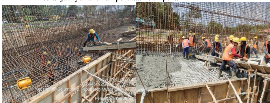
Gambar 5 Pekerjaan Pengecoran

Volume pile cap : 1,2 \text{ m} \times 1,08 \text{ m} \times 8 \text{ m} = 10,36 \text{ m}^3