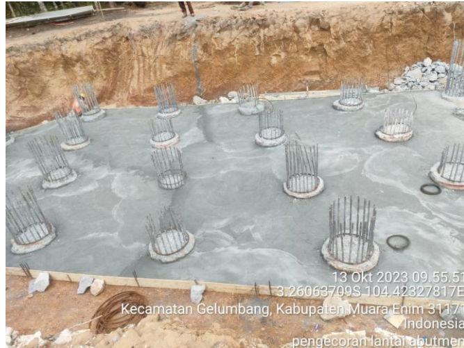
Gambar 2 Pengecoran lantai