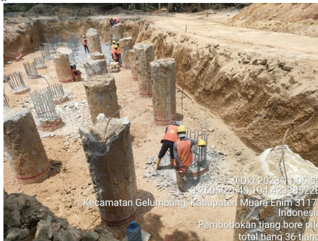
Gambar 1 Pembobokan Bore Pile