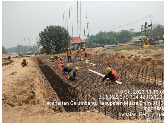
Gambar 4 Pemasangan besi