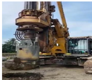
Gambar. 2 Pekerjaan Pre-boring