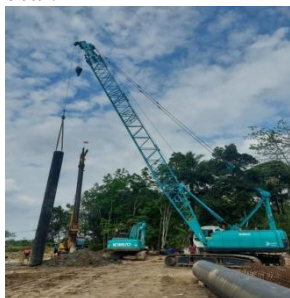
Gambar.9 Temporary Casing

Setelah pengecoran selesai, dilakukan pencabutan casing sementara ( temporary casing ) dengan cara mengaitkan lubang pada kedua sisi casing dengan pengunci pada crane, Kemudian diangkat dengan hati-hati agar posisi casing tidak miring saat dicabut, dan proses pengecoran bored pile selesai.