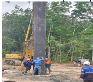
Gambar. 3 Pemasangan Casing