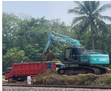
Gambar.1 Persiapan lokasi

Pekerjaan persiapan merupakan tahapan paling awal dari suatu proyek. Pekerjaan persiapan merupakan tahapan paling awal dari suatu proyek. Dengan adanya tahap persiapan, pekerjaan selanjutnya bisa lebih teratur dan lancer. Persiapan Lokasi Pekerjaan perlu dilakukan pembersihan benda-benda berat seperti reruntuhan dapat dilakukan dengan menggunakan alat berat excavator .