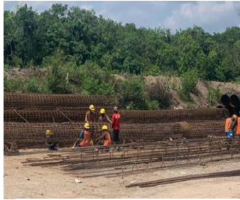
Gambar. 4 Pekerjaan Fabrikasi