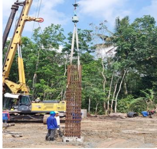
Gambar. 7 Instalasi Keranjang Besi