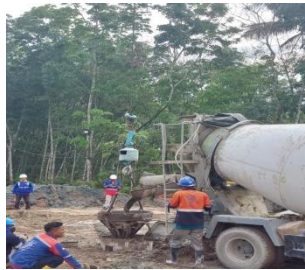
Gambar. 8 Proses Pengecoran