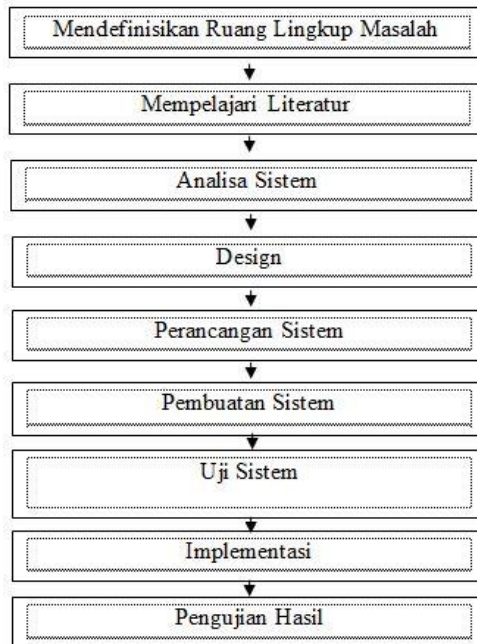
Gambar 1. Metodologi Penelitian

Kerangka kerja ini merupakan langkah-langkah yang akan dilakukan dalam rangka penyelesaian masalah yang akan dibahas, seperti gambar 1: