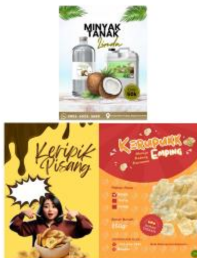
Gambar 2. Contoh Desain Produk Kemasan

Peserta UMKM dalam kegiatan ini juga akan mendapatkan pelatihan mengenai pencatatan laporan keuangan berbasis digitalisasi menggunakan sistem SIAPIK, yang bertujuan untuk meningkatkan efisiensi dan akurasi dalam pengelolaan keuangan. SIAPIK adalah aplikasi laporan keuangan digital yang bisa mempermudah UMKM dalam melakukan