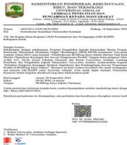
Gambar 5. Surat Permohonan Kesiediaan Narasumber