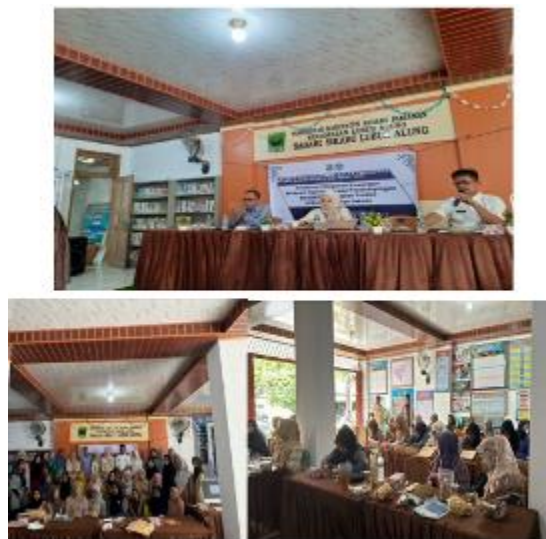
Gambar 3. Sosialisasi Kegiatan oleh Silmi tentang Pencatatan Keuangan menggunakan SIAPIK

Pelatihan dan Pendampingan Pencatatan Keuangan menggunakan SIAPIK dilaksanakan di Aula BUMNag Saiyo Sakato pada hari Jumat tanggal 20 September 2024 yang dihadiri oleh anggota tim pengabdian, mahasiswa dan sebanyak 40 UMKM Binaan BUMNag Saiyo Sakato.