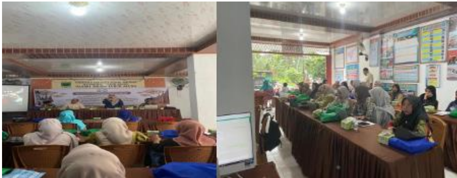
Gambar 1. Sosialisasi Kegiatan oleh Prima Fitri tentang Pengemasan Produk yang Sesuai dengan SNI

Pelatihan dan pendampingan yang pertama mencakup pemahaman tentang persyaratan SNI untuk bahan kemasan, proses pengemasan yang tepat, dan metode pengujian untuk memastikan kepatuhan terhadap standar. Pendampingan dilakukan oleh Ibu Prima Fitri yang sudah ahli dan berpengalaman dalam industri pengemasan, pelatihan dan pendampingan ini dapat membantu BUMNag Saiyo Sakato dalam menerapkan praktik terbaik dan solusi kreatif untuk memenuhi standar SNI dengan efisien. Dengan pelatihan dan pendampingan yang sudah dilakukan pada hari Selasa tanggal 17 September 2024 diharapkan BUMNag Saiyo Sakato dapat memperbaiki proses pengemasan mereka, meningkatkan kualitas produk, serta memastikan kepatuhan terhadap regulasi yang berlaku. Hal ini tidak hanya akan meningkatkan kepercayaan konsumen terhadap produk mereka, tetapi juga dapat membuka peluang untuk ekspansi pasar dan pertumbuhan bisnis yang berkelanjutan.