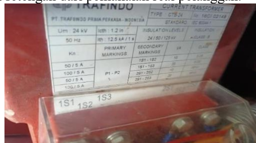
Gambar 7. CT pelanggan PT. Juya Mining Aceh

Setelah di lakukan perbaikan wiring dan mengganti rasio CT dari rasio 100/5 ke rasio 50/5, maka hasil dari pemakaian pelanggan sudah normal kembali. Berikut hasil penarikan data Load Profile AMR pelanggan setelah dilakukan perbaikan wiring. Dilihat dari Load Profile AMR pelanggan, arus pemakaian pelanggan pada sisi Sekunder TR sudah sesuai dengan arus primer TM yang di gunakan oleh pelanggan.