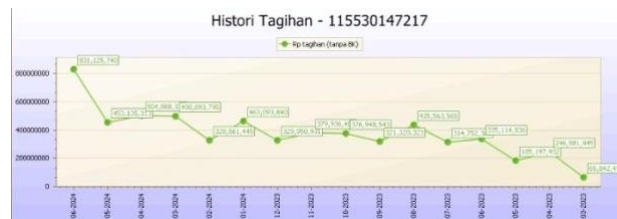
Gambar 8. History Tagihan Listrik Pelanggan