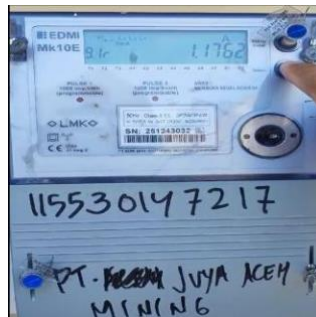
Gambar 6. kWh Meter PT.Juya Mining Aceh

Pada kubikel Pelanggan terdapat Potensial Transformator (PT) dan Current Transformator (CT). PT merupakan trafo untuk mengkonversi tegangan dari 20000V ke tegangan 100V untuk pengukuran karena tidak ada spesifikasi alat ukur yang mempunyai tegangan sumber sebesar 20000V P-P dengan rasio Potensial Transformeter (PT) yaitu 20000/100. Artinya jika pelanggan menggunakan tegangan TM 20000 V maka di sisi pengukuran dan proteksi akan terukur 100 V. Sedangkan untuk Trafo Arus (CT) digunakan untuk mengkonversi nilai arus yang besar ke arus yang lebih kecil sehingga kebaca pada alat ukur kWh Meter.