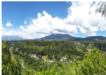
Gambar 1 Ngarai Koto Barangai

Kelurahan Bukit Apit Puhun adalah salah satu destinasi wisata yang ada di Kota Bukittinggi yang memiliki potensi wisata alam yang sangat indah. Kelurahan ini tidak hanya menonjolkan keindahan alam yang dimilikinya, namun juga terdapat Kopi Bukitapit yang terkenal secara nasional, kopi bukitapit adalah usaha rumahan masyarakat yang menyangrai biji kopi yang merupakan budaya masyarakat lokal yang sekaligus juga menjadi pendorong perekonomian warga karena telah diwariskan secara turun temurun. Kelurahan Bukit Apit ini memang sudah dikenal sebagai daerah pemasok bubuk kopi robusta yang memiliki aroma dan rasa khas. Untuk potensi pariwisata melalui keindahan alam di kelurahan Bukit Apit Puhun memiliki Ngarai Koto Barangai yang tidak kalah indah dari objek wisata di kelurahan bukit apit puhun yang sudah ada seperti janjang saribu. Ngarai Koto Barangai memiliki potensi luar biasa yang patut untuk segera dikembangkan dalam rangka meningkatkan perekonomian masyarakat kota Bukittinggi khususnya di kelurahan Bukit Apit Puhun