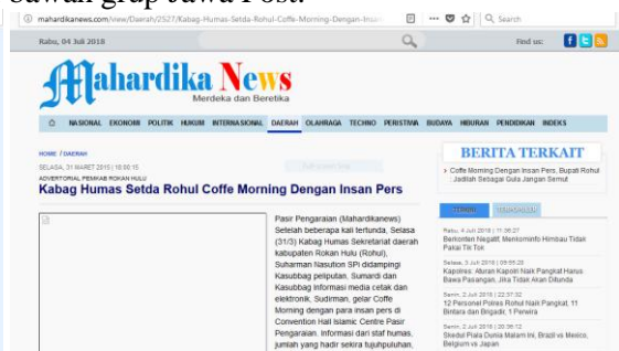
Media : Mahardika News