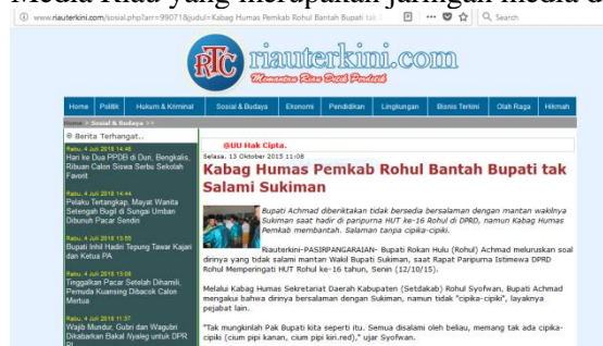
Media : Riau Terkini.com

Menurut Kepala Sub Bagian Peliputan, Dokumentasi dan Publikasi, Ibu Tanti Ekasari, yang pertama yakni Bagian Humas pada kegiatannya dalam pelaksanaan penyebaran informasi kegiatan daerah dengan cara pembuatan serta penyebaran press release dan keterangan langsung yang diberikan oleh Bupati maupun melalui Bagian Humas kepada media massa yang tujuannya agar dapat didengar dan dilihat oleh masyarakat luas. Dalam sekali peliputan kegiatan pemerintahan, beberapa wartawan dari media massa yang telah tergabung dalam anggota press room Pemerintah Kabupaten Rokan Hulu, hanya sekitar 5 (lima) media massa yang diundang namun pengaturannya diatur secara bergilir oleh Bagian Humas. Dari keterangan Kepala Sub Bagian Peliputan, Dokumentasi dan Publikasi Bagian Humas Kabupaten Rokan Hulu, Ibu Tanti Ekasari, terdapat beberapa media seperti Riau Pos, Media Riau yang merupakan jaringan media di bawah grup Jawa Post.