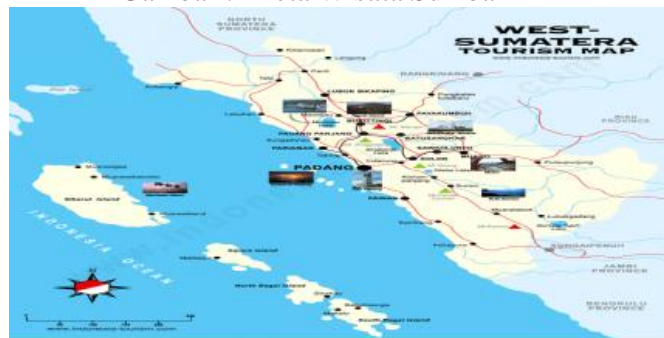
Gambar :1 Peta Wisata Sumbar