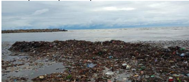
13 Januari 2020

Namun dari apa yang diuraikan tadi, Taplau Padang kurang didukung dengan kebersihan yang ada disekitar pantainya. Banyak kita melihat sampah masih berserakan dibibir pantai, bahkan ada disekitar trotoar jalan. Apalagi terjadi hujan yang lebat. Sampah menjadi pemandangan yang tidak asing lagi ada disekitaran pantai. Keberadaan sampah ini, menyebabkan pantai menjadi kotor. Bahkan dari Pantauan Liputan6.com di Taplau Padang, pada hari jumat sore, pada tanggal 9 Januari 2020, sampah bertebaran di pantai sekitar Tugu Merpati yang menjadi spot favorit wisatawan. Air laut di Taplau Padang juga tampak berwarna kehitam-hitaman. Pantai yang biasanya bersih berubah menjadi tempat pembuangan dengan berbagai jenis sampah, mulai dari popok bayi, pakaian sampai ban bekas. Bau busuk meruap dari tumpukan sampah itu.