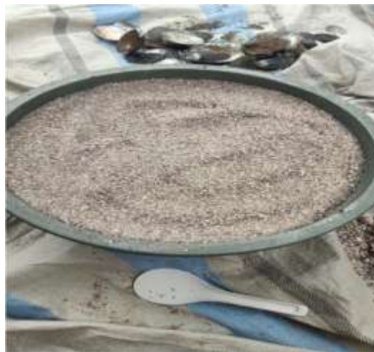
Gambar 3. Serbuk Cangkang Loka