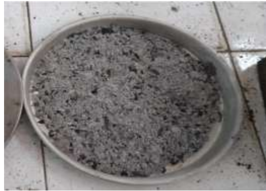
Gambar 2. Abu Kertas