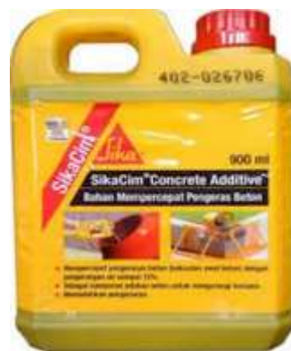
Gambar 4. SikaCim Concrete Additive

Peralatan untuk pengolahan kertas digunakan tungku pembakaran, serta alat-alat untuk pengujian agregat kasar dan agregat halus terdiri dari; timbangan, saringan untuk pengujian gradasi, oven, talem logam, mesin penggetar saringan ( sieve shaker ), kuas, sikat kuningan, sendok, gelas ukur berisi larutan NAOH 3%, standar warna ( organic plat ), silinder, tongkat pemadat, mistar baja, handuk, mesin penggetar ( vibrator ), kompor listrik, keranjang besi beserta alat penggantung, bak perendam, kerucut terpancung, labu takar (piknometer), jam/stopwatch, dan mesin abrasi Los Angeles. Alat-alat pembuatan benda uji terdiri dari; sekop, ember, timbangan, gelas ukur, mixer /molen, sendok semen, dan cetakan kubus 15cm x 15cm x 15cm. Alat pengujian slump berupa kerucut abrams , dan tongkat pemadat, stopwatch, mistar. Alat pengujian