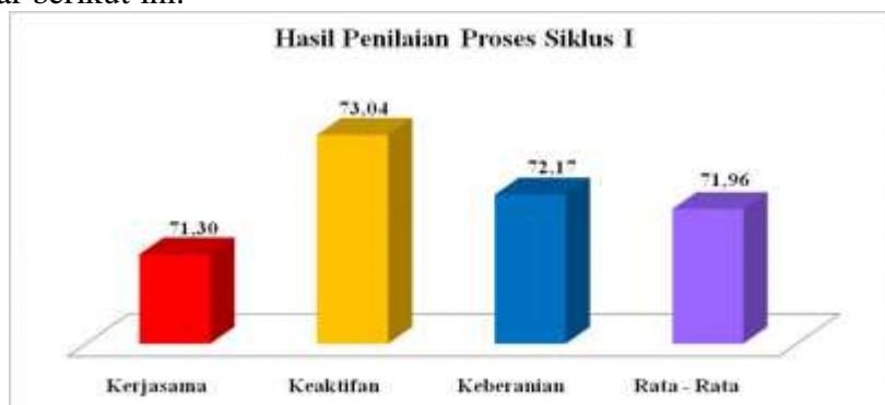
Diagram Hasil Penilaian Proses pada Tindakan Siklus 1

Hasil penilaian proses pada tindakan siklus 1, juga disajikan melalui grafik pada gambar berikut ini: