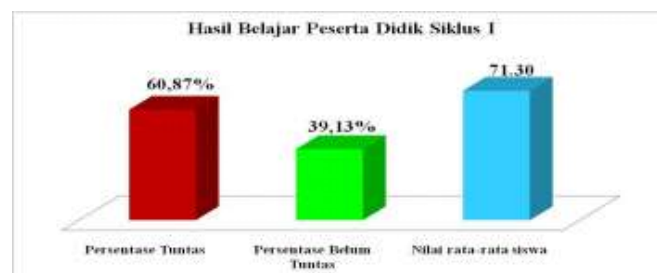
Diagram Hasil Belajar Peserta Didik Siklus 1

Berdasarkan hasil belajar Bahasa Indonesia khususnya pada tema Peristiwa dalam Kehidupan sub tema Peristiwa Kebangsaan Seputar Proklamasi Kemerdekaan materi teks narasi sejarah pada tindakan siklus 1 siswa kelas V UPT. SD Negeri 18 Baringin, diketahui bahwa jumlah nilai rata-rata kelas adalah 71,30. Siswa yang memenuhi KKM sebanyak 14 siswa atau mencapai 60,87%, sedangkan siswa yang belum memenuhi KKM sebanyak 9 siswa atau mencapai 39,13%. hasil belajar Bahasa Indonesia pada tindakan siklus 1, juga disajikan melalui grafik pada gambar berikut ini: