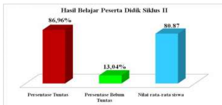
Grafik Hasil Belajar Siswa pada Tindakan Siklus II

Berdasarkan hasil belajar Bahasa Indonesia khususnya pada tema Peristiwa dalam Kehidupan sub tema Peristiwa Kebangsaan Seputar Proklamasi Kemerdekaan materi teks narasi sejarah pada tindakan siklus II siswa kelas V UPT. SD Negeri 18 Baringin, diketahui bahwa jumlah nilai rata-rata kelas adalah 80,87. Siswa yang memenuhi KKM sebanyak 20 siswa atau mencapai 86,96%, sedangkan siswa yang belum memenuhi KKM sebanyak 3 siswa atau mencapai 13,04%. Hasil belajar Bahasa Indonesia pada tindakan siklus II, juga disajikan melalui diagram pada gambar berikut ini: