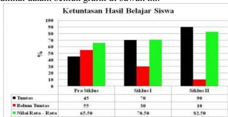
Gambar Diagram 4 : Ketuntasan Hasil Belajar Siswa

Dari tabel di atas dapat dilihat bahwa ada peningkatan dari hasil pre test , siklus I dan siklus II. Hal tersebut dapat dilihat dari kenaikan nilai rata-rata kelas, penambahan jumlah siswa yang memperoleh nilai \geq 71 , serta peningkatan presentase ketuntasan klasikal. Dengan demikian, model pembelajaran Course Review Horay mata pelajaran IPS pada Tema Peristiwa dalam Kehidupan Sub tema Peristiwa Kebangsaan Masa Penjajahan pada kelas V UPT. SD Negeri 01 Koto Laweh Kecamatan X Koto. Kabupaten Tanah Datar dapat meningkatkan hasil belajar siswa. Hal ini dapat dilihat dalam bentuk grafik di bawah ini.