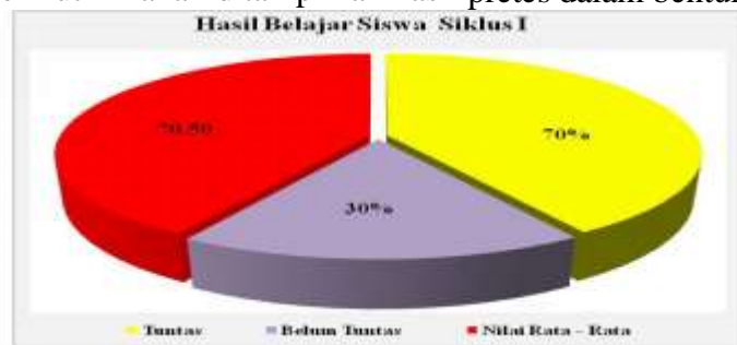
Diagram Hasil Belajar Siswa Siklus I

yang kurang berpartisipasi serta masih rendahnya pengetahuan siswa mengenai materi kedatangan bangsa-bangsa Eropa di Indonesia. Berdasarkan hasil perhitungan presentase ketuntasan klasikal sebelumnya (45%) dan pada siklus I (70%), maka dapat diketahui bahwa terjadi peningkatan sebesar 25%. Hal tersebut dikarenakan proses belajar mengajar dilakukan dengan menggunakan model Course Review Horay. Meskipun demikian, keberhasilan proses belajar mengajar pada siklus I masih belum tercapai karena belum sesuai dengan presentase ketuntasan klasikal yaitu \geq 80\% . Untuk lebih jelasnya, berikut ini akan ditampilkan hasil pretes dalam bentuk diagram.