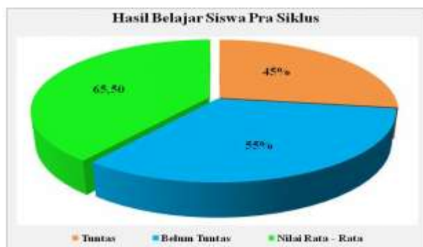
Diagram Hasil Belajar Siswa Pra Siklus