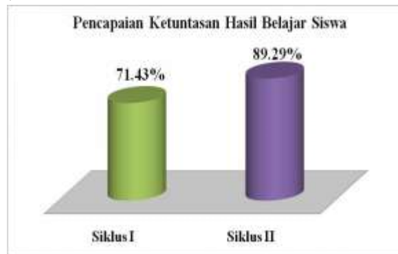
Gambar Pencapaian Ketuntasan Hasil Belajar Siswa

Berdasarkan hasil penelitian yang diperoleh hasil belajar IPS siswa kelas V-A UPT SD Negeri 01 Limo Kaum Kecamatan Lima Kaum Kabupaten Tanah Datar pada siklus 1 menunjukkan jumlah siswa yang mencapai ketuntasan belajar sebanyak 20 siswa dan belum tuntas 8 siswa dengan persentase 71,43% dengan rata-rata nilai sebesar 74,29 dan siklus 2 menunjukkan jumlah siswa yang tuntas sebanyak 25 siswa dan yang tidak tuntas sebanyak 3 siswa dengan persentase 89,29% dengan rata-rata nilai sebesar 82,86. Data peningkatan hasil belajar IPS kelas V-A UPT SD Negeri 01 Limo Kaum Kecamatan Lima Kaum Kabupaten Tanah Datar dapat dilihat pada Gambar 4 berikut ini: