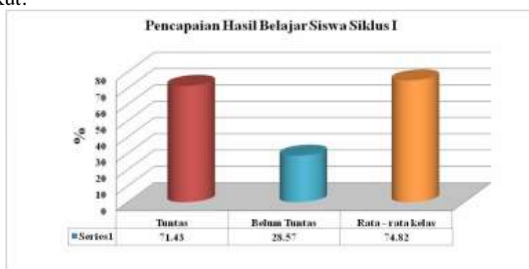
Gambar Pencapaian Hasil Belajar Siswa pada Siklus I

Berdasarkan tabel di atas, rata-rata kelas yang diperoleh adalah 74,82 Siswa yang mencapai KKM ( 80 ) sejumlah 20 siswa atau sebesar 71,43% sedangkan siswa yang nilainya belum mencapai KKM sejumlah 8 siswa atau sebesar 28,57%. Apabila pencapaian hasil belajar siswa pada siklus I disajikan dalam bentuk diagram tabung sebagai berikut: