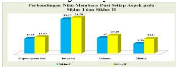
Diagram Perbandingan Nilai Membaca Puisi Setiap Aspek Pada Siklus I dan Siklus II

Perbandingan Nilai Membaca Puisi Setiap Aspek Pada Siklus I Dan Siklus IIsiswa dapat dimasukkan dalam diagram sebagai berikut.