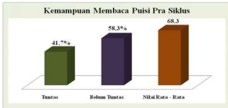
Gambar Diagram Kemampuan Membaca Puisi Awal (Pra Siklus)

Dari diagram kemampuan membaca puisi awal (pra siklus) diatas dapat disimpulkan sebagai berikut: 1) Pada tahap pra siklus hanya terdapat 5 siswa yang memenuhi nilai rata- rata kelas kemampuan membaca puisi sedangkan 7 siswa lainnya belum memenuhi nilai rata-rata kelas kemampuan membaca puisi; 2) Presentase siswa yang memenuhi nilai rata-rata kelas kemampuan membaca puisi adalah 41,7%, sedangkan yang belum memenuhi adalah 58,3%; dan 3) Nilai rata-rata siswa adalah 68,3