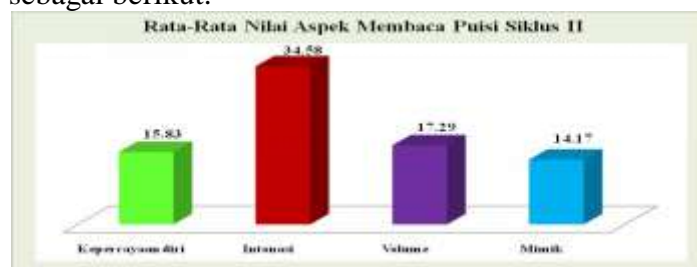
Diagram Rata-Rata Nilai Aspek Membaca Puisi Siklus II

Hasil membaca puisi Aspek Membaca Puisi Siklus II siswa dapat dimasukkan dalam diagram sebagai berikut.