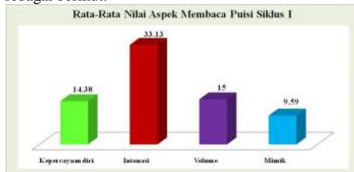
Gambar Diagram Rata-Rata Nilai Aspek Membaca Puisi Siklus I

Hasil membaca puisi Aspek Membaca Puisi Siklus I siswa dapat dimasukkan dalam diagram sebagai berikut: