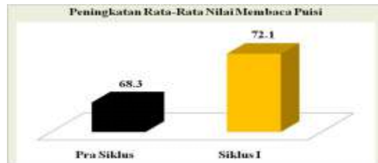
Gambar Peningkatan Rata-Rata Nilai Kemampuan Membaca Puisi

nilai 15 dengan predikat C (cukup), dan aspek mimik kinesika mendapatkan rata-rata nilai 9,59 dengan predikat K (kurang). Hasil peningkatan nilai rata-rata membaca puisi dari nilai pra siklus menjadi nilai siklus I dapat digambarkan dalam diagram 4 sebagai berikut.