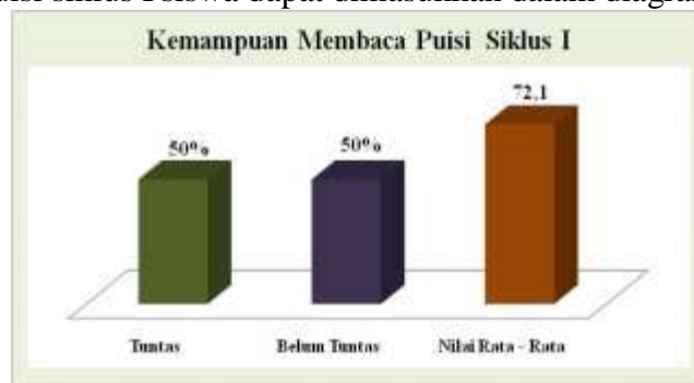
Diagram Kemampuan Membaca Puisi Siklus I

Hasil rata-rata nilai kemampuan membaca puisi kelas I adalah 72,1 dengan predikat B (baik) serta capaian 50% sudah memenuhi nilai kriteria keberhasilan dan 50% belum memenuhi nilai kriteria keberhasilan. Hal ini menunjukkan bahwa kemampuan membaca puisi siswa kelas I UPT SD Negeri 17 Saruaso, Kecamatan Tanjung Emas belum mencapai kriteria keberhasilan yang diharapkan, yaitu \geq 85\% dari jumlah siswa mendapat nilai yang mencapai kriteria keberhasilan tindakan \geq 75 . Hasil membaca puisi siklus I siswa dapat dimasukkan dalam diagram sebagai berikut.