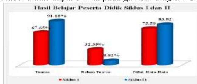
Gambar Hasil belajar Peserta Didik Siklus I dan II

Berdasarkan tabel diatas dapat dilihat pada gambar diagram dibawah ini