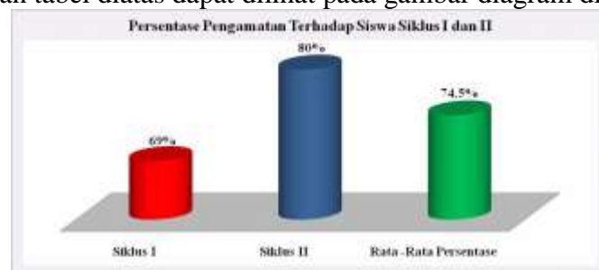
Gambar Persentase Pengamatan Terhadap Siswa Siklus I dan II

Berdasarkan tabel diatas dapat dilihat pada gambar diagram dibawah ini