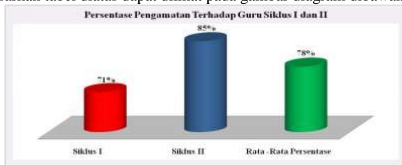
Gambar 4 : Persentase Pengamatan Terhadap Guru Siklus I dan II

Berdasarkan tabel diatas dapat dilihat pada gambar diagram dibawah ini