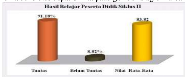
Gambar Hasil Belajar Peserta Didik Pada Siklus II

Berdasarkan tabel diatas dapat dilihat pada gambar diagram dibawah ini'