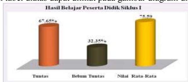
Gambar Hasil Belajar Peserta Didik Pada Siklus I

Berdasarkan tabel diatas dapat dilihat pada gambar diagram dibawah ini'