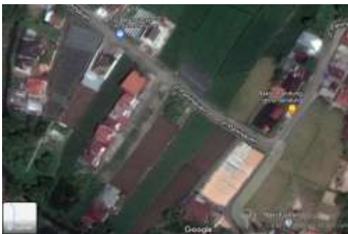
Gambar 3.1 Lokasi Penelitian

Lokasi penelitian ini dilakukan di Laboratorium Fakultas Teknik, Universitas Muhammadiyah Sumatera Barat, Jalan Paninjauan, Kecamatan Mandiangin Koto Selayan, Kota Bukittinggi, Sumatera Barat dengan menggunakan peralatan yang telah sesuai dengan Standar Nasional Indonesia (SNI).