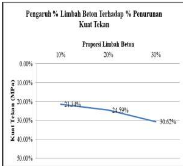
Gambar 5.1 Grafik Pengaruh % Limbah Beton Terhadap % Penurunan Kuat Tekan