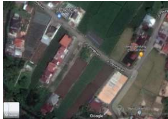
Gambar 3.1 Denah Lokasi Penelitian

Sumatera Barat. Jl. Paninjauan, Kec. Mandiangin Koto Selayan, Kota Bukittinggi, Sumatera Barat.