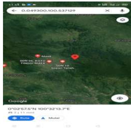
Gambar 3.1 Lokasi penelitian (Maek, Kec.Bukit Barisan, Kab.Lima Puluh Kota)

Bagian Timur : berbatasan dengan Provinsi Riau.