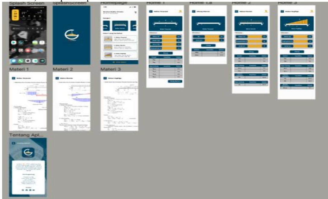
Gambar 3. Tampilan aplikasi